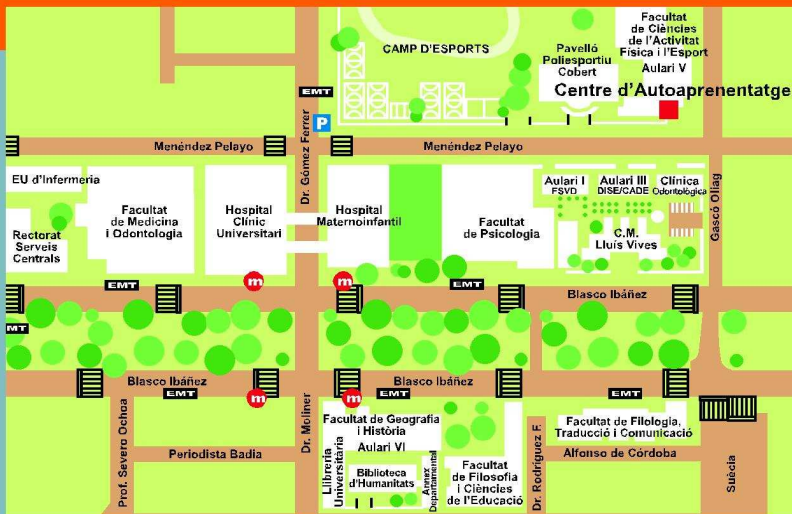
Centre d'Autoaprenentatge de Llengües Campus de Blasco Ibáñez Aulari V C/ Gascó Oliag, 3, planta baixa 46010 València

La Universitat... en valencià mola molt més!